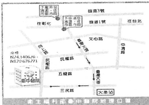
衛生福利部臺中醫院地理位置圖